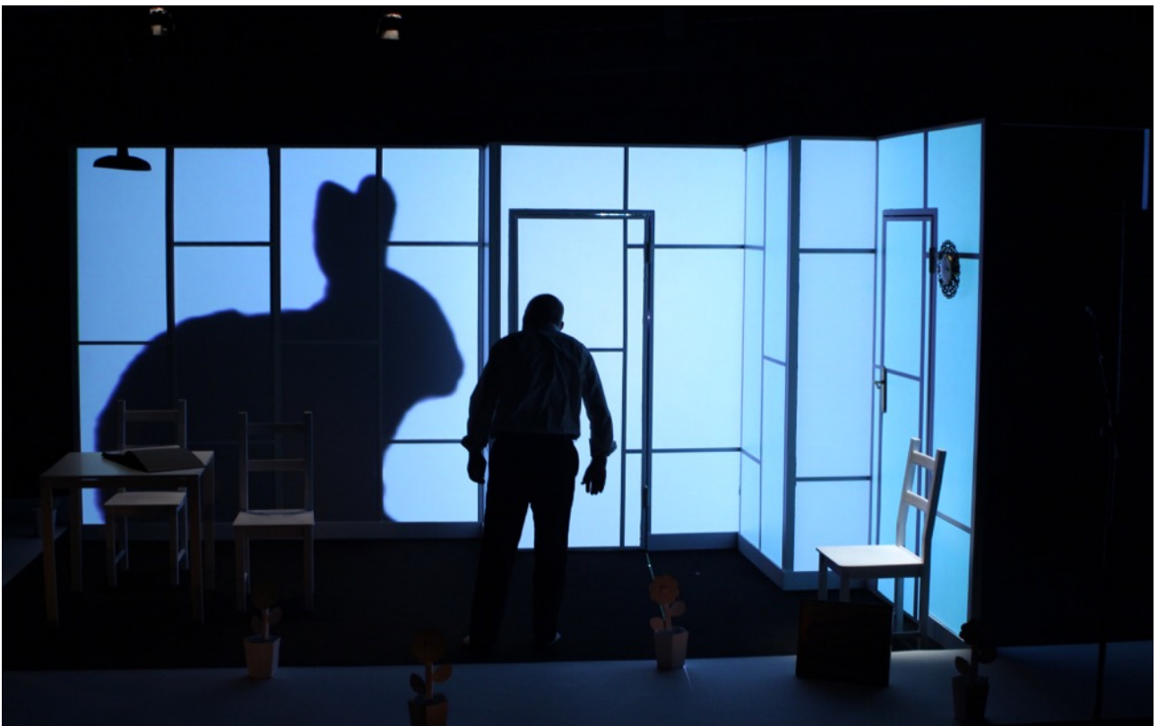
Variacions Kraepelin, Sala Beckett 2012