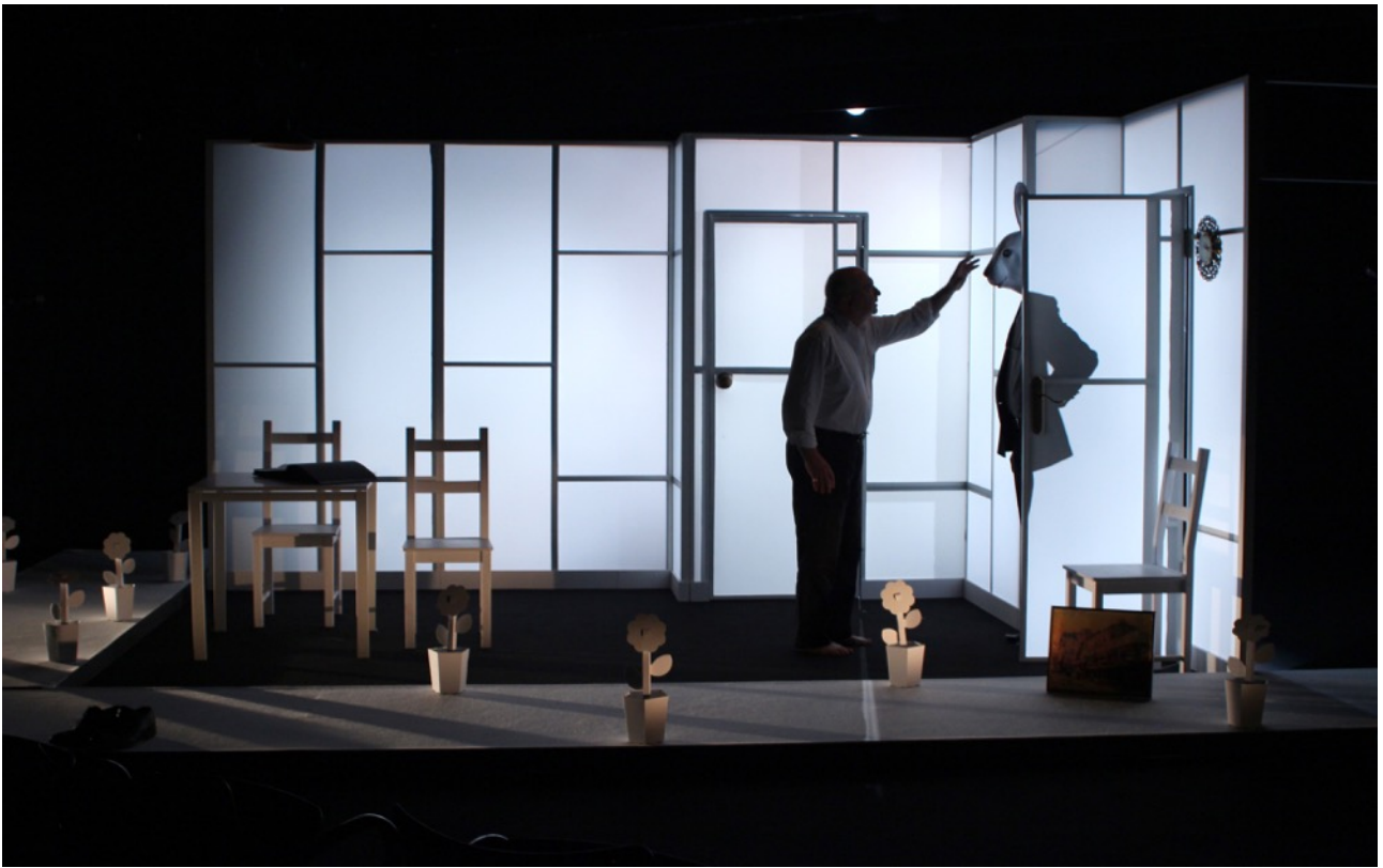
Variacions Kraepelin, Sala Beckett 2012