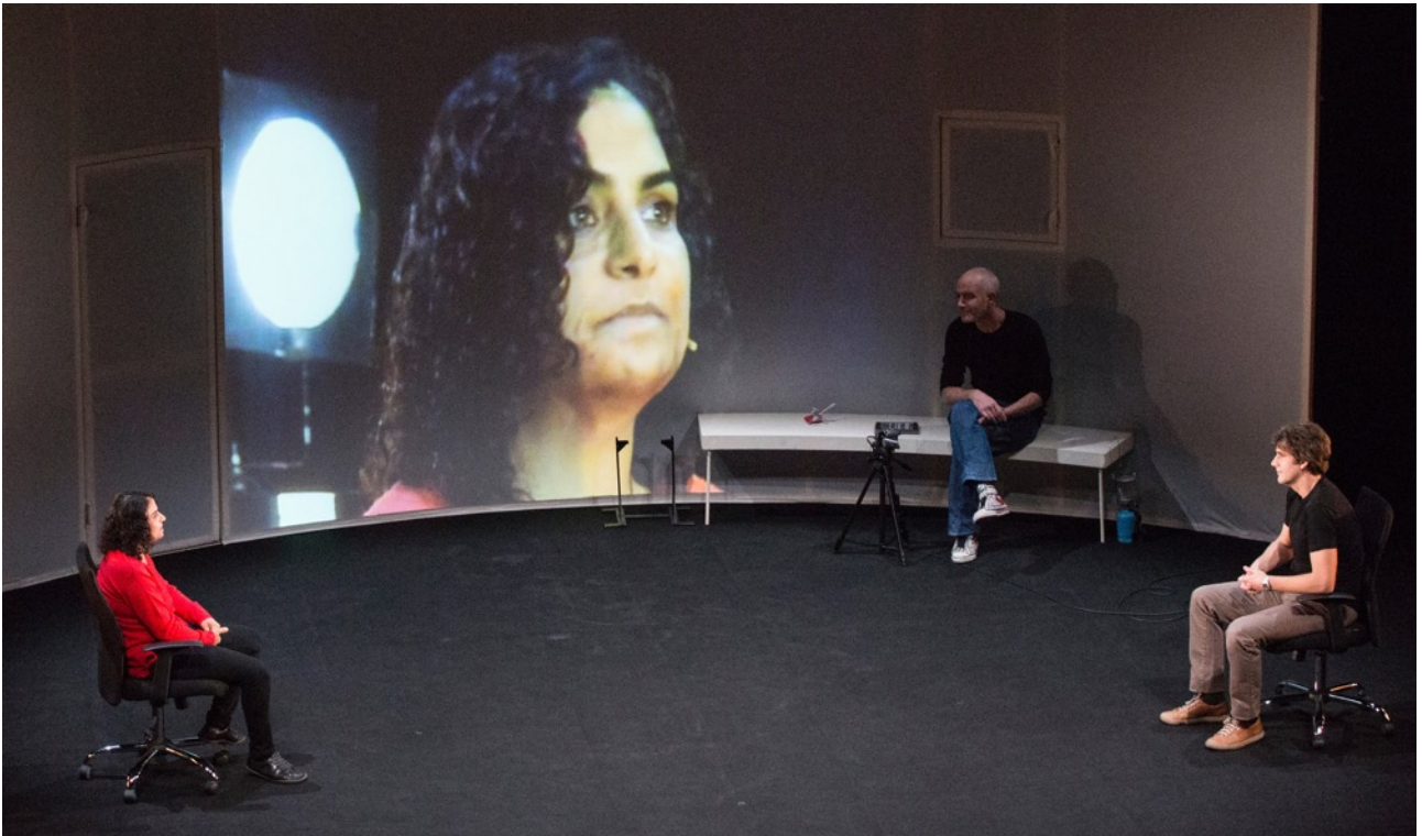
Nadia , CCCB, Grec Festival 2014

Nos interesa explorar como la poesía emerge de la realidad.