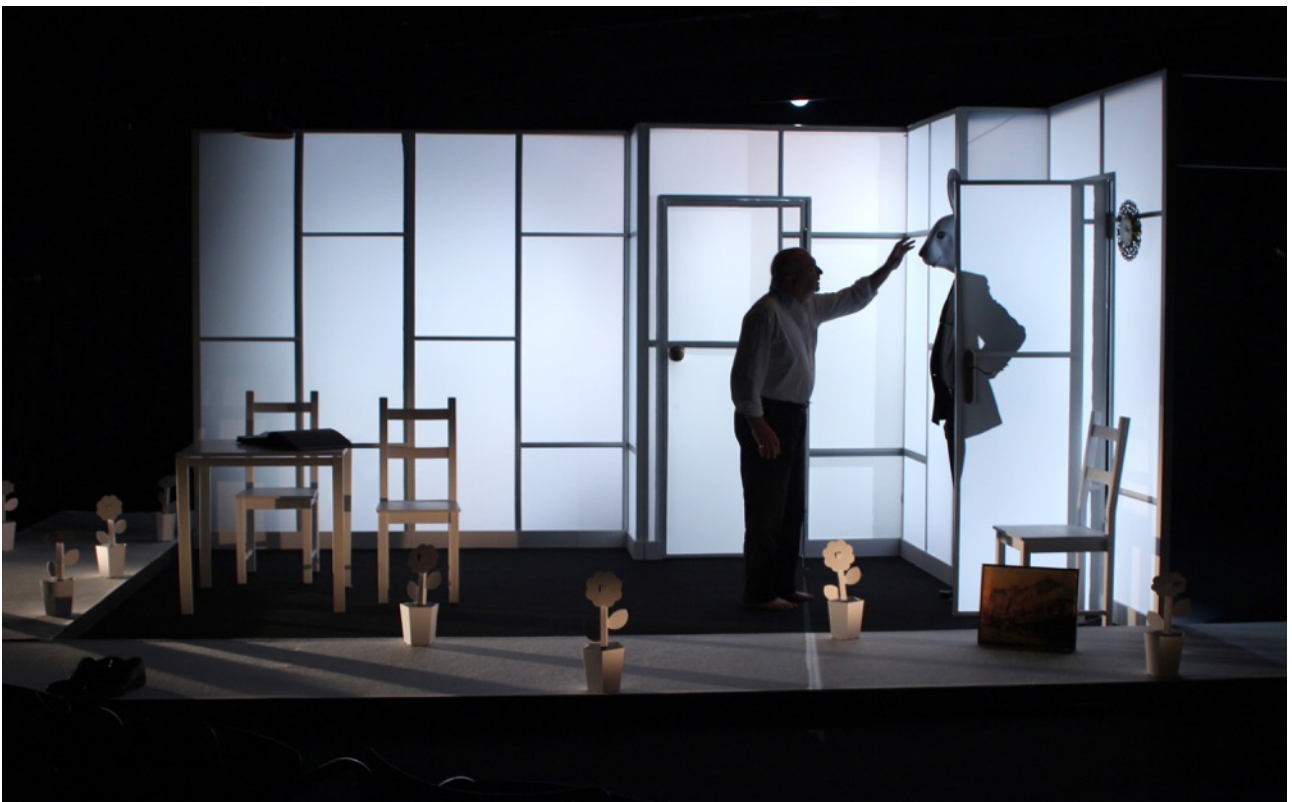
Variacions Kraepelin, Sala Beckett 2012