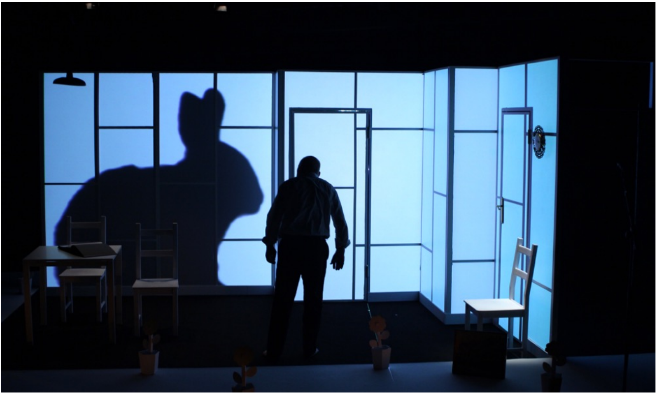
Variacions Kraepelin, Sala Beckett 2012